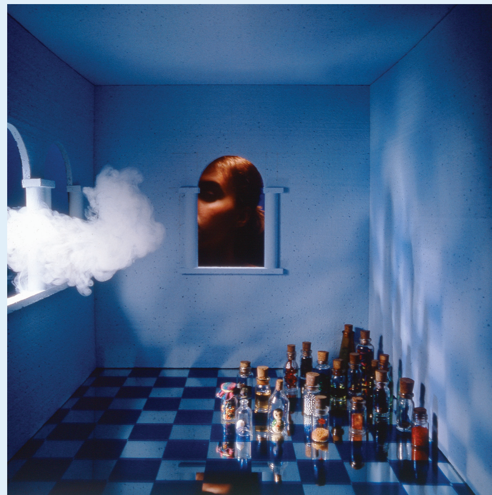
Blue Box 4