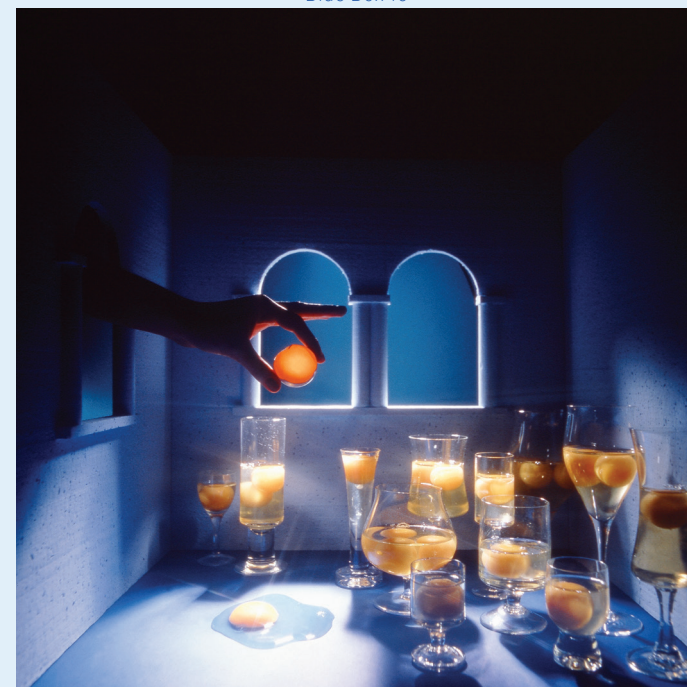
Blue Box 10