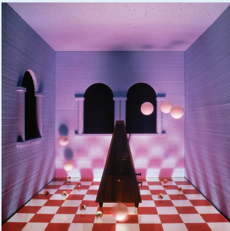
Blue Box 5