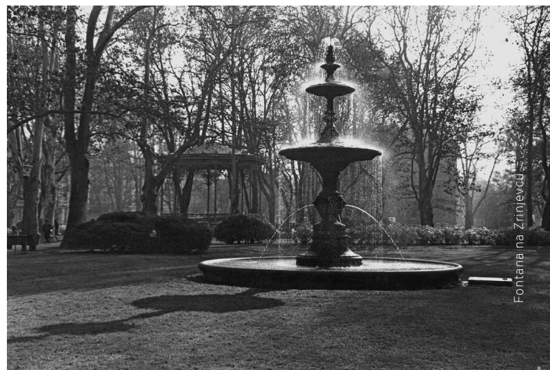
Fontana na Zrinjevcu