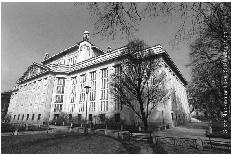
Stara Nacionalna i sveučilišna knjižnica