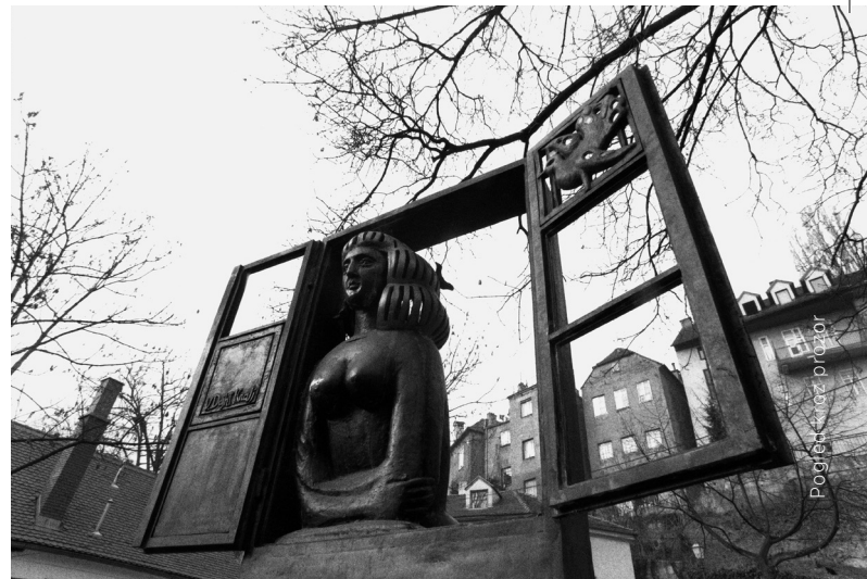
Pogled kroz prizor