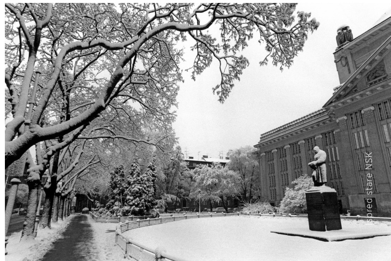
ispred stare NSK