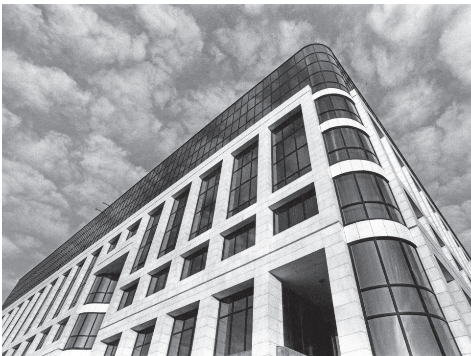
INA u oblacima