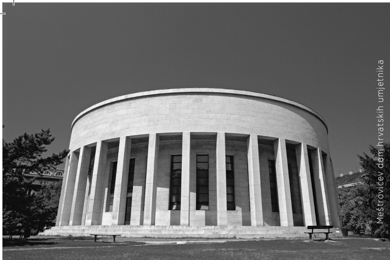
Meštrovićev dom hrvatskih umjetnika