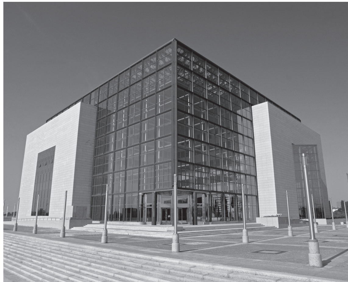
Nacionalna i sveučilišna knjižnica